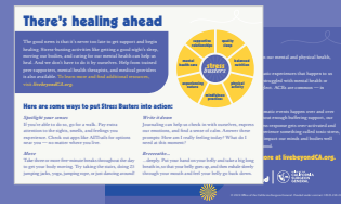
Tarjeta de mano

Una guía rápida para los pacientes sobre cómo acceder a más apoyo para ayudar a sanar de los impactos de sus ACE y el estrés tóxico, encontrar un proveedor de atención de salud mental, comenzar una conversación y más.