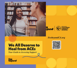
Guía para que los pacientes accedan al apoyo